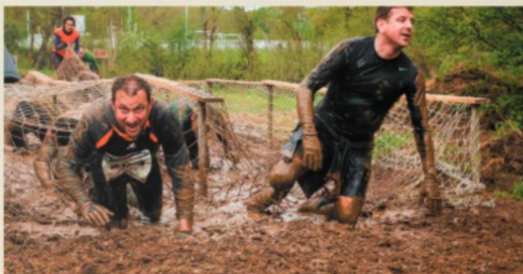
Le X-Maines Race à Saint-Georges-de-Montaigu a lieu le 28 avril.

A Saint-Georges-de-Montaigu. Le dimanche 28 avril , X-Maines Race, cinquième édition, départ à côté du complexe sportif. Course à pied d'obstacles à dompter seul ou en équipe, sur une distance d'environ 10 km. 700 participants attendus. Epreuve ouverte à tout combattant,