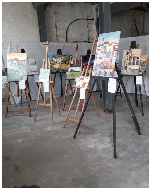
Exposition concours Rocheservière & co

Les œuvres du concours Rocheservière & co seront exposées du samedi au dimanche, tandis que les œuvres réalisées lors du concours Grand Format seront exposées à l'issue du concours, le dimanche à partir de 17h sous les halles de la Mairie.